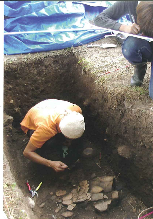
長畑遺跡発掘調査の様子

2階に大空間を設けるなど、養蚕による建物の改造が多く、近代以降、養蚕の発達によって生業が変化した歴史を語るものとして価値が高いことなどがわかりました。