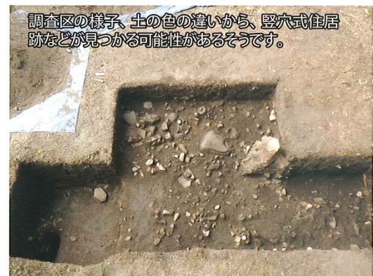
調査区の様子。土の色の違いから、竪穴式住居跡などが見つかる可能性があるそうです。

また今回の調査で、長畑遺跡では遺構(地面に残された竪穴住居などの痕跡)が埋まっている可能性が高いことがわかりました。そのため、今後も発掘調査が継続される予定です。遺跡を通して地域の昔の暮らしが明らかになることが期待されます。