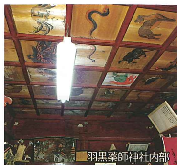
羽黒薬師神社内部

文化財保護委員会は、町にとって重要な文化財の保存・活用等に関し、教育委員会の諮問に答えることや調査研究を行うために設置されています。平成23年度は御戸帳の追加指定に係る調査や町内の文書、建物などの調査をおこないました。