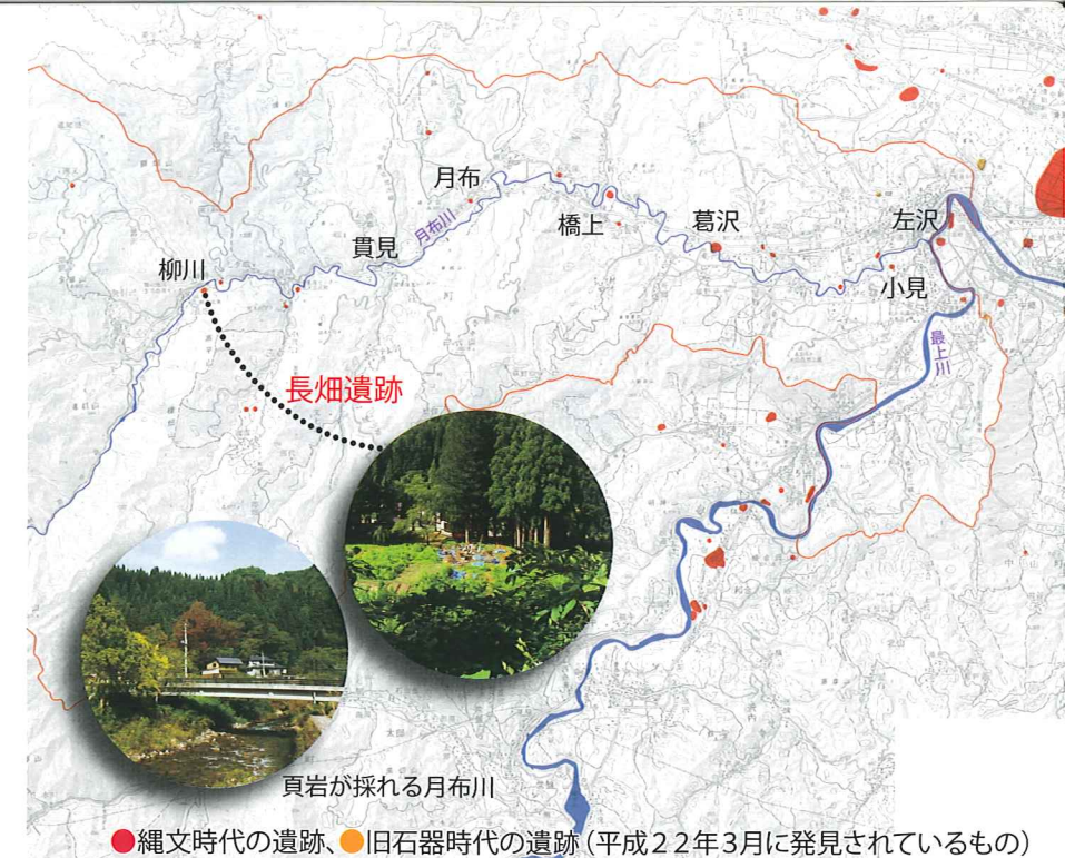
長畑遺跡の位置と町内で見つかった縄文時代・旧石器時代の遺跡の分布