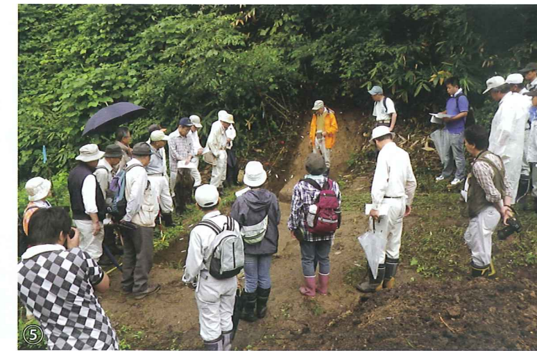
①左沢楯山城跡航空写真、赤い線の範囲が国史跡指定地 ②蛇沢の調査区で見つかった布堀状の遺構(1T) ③ワークショップの様子 ④発掘調査の様子(八幡座) ⑤現地説明会の様子 ⑥「八幡座」で見つかった建物跡(岩盤に掘りこまれた穴が建物を構成する掘立柱の跡)