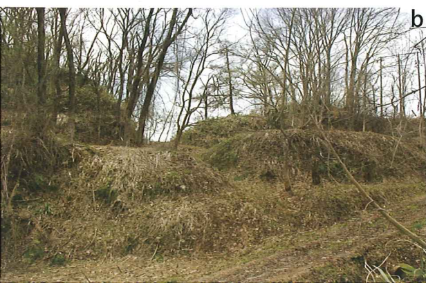
a 大江町では30カ所の中世城館跡が確認されている(図黄色部分が城館跡、緑が左沢楯山城跡) b 左沢楯山城跡の堀切(くぼんでいる地形の部分) c 左沢楯山城跡の縄張図、防御のための急な斜面「切岸」(図の■部分)で囲まれた平坦地(図の白い部分)、「曲輪」が楯山一帯に造成されている