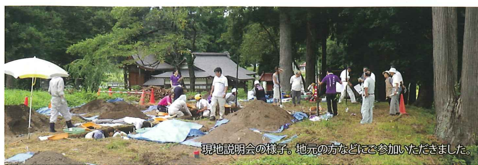
現地説明会の様子。地元の方などにご参加いただきました。