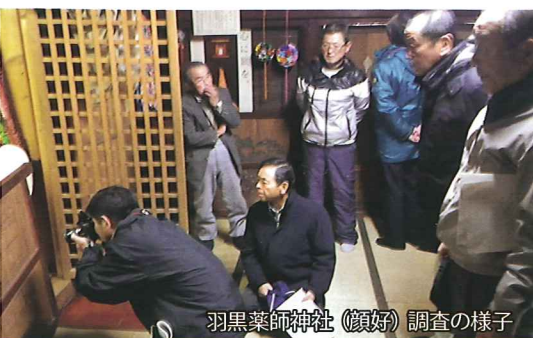
羽黒薬師神社(顔好)調査の様子