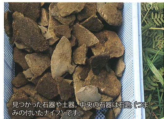
見つかった石器や土器。中央の石器は石匙(つまみの付いたナイフ)です。