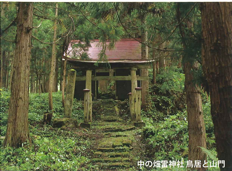
中の畑雷神社 鳥居と山門