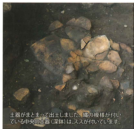
土器がまとまって出土しました。縄の模様が付いている中央の土器(深鉢)は、ススが付いています。