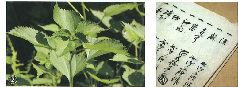
①「御戸帳」が奉納されていた雷神社の内部 ②七軒地区の特産物であった青苧、現在町内各地に自生している ③産物取調書上帳(明治5年、黒森村)青苧を産したことが記録されている(中の畑は黒森の枝郷だった) ④修理前の御戸帳 ⑤御戸帳の修理作業(東北芸術工科大学)