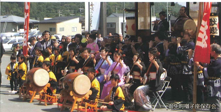
御免町囃子座保存会

御免町囃子座保存会は、長年にわたる地道な活動により、子どもたちへの指導体制が確立され、演奏技術の確実な継承に努めていることなどが評価されて「山形ふるさと塾」村山地域優秀賞を受賞しました。