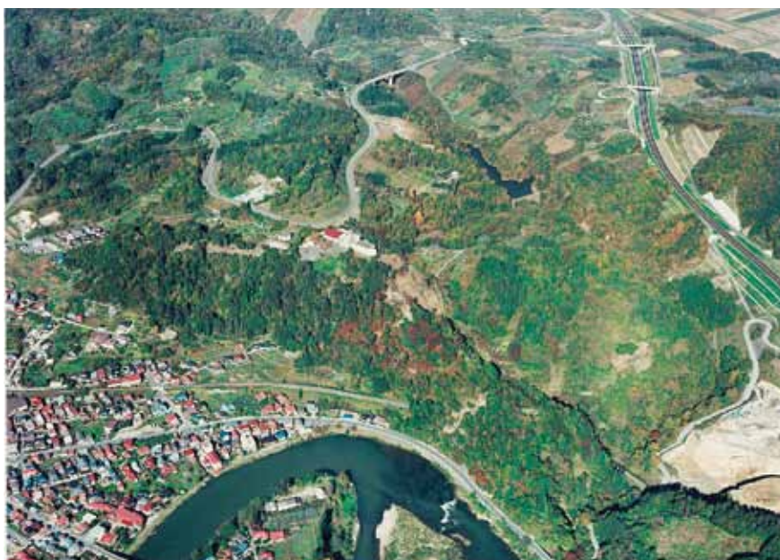
(図) 左沢楯山城跡縄張図 (写真) 左沢楯山城跡航空写真

史跡左沢楯山城跡の整備について、平成25年度からは楯山公園部分の整備に着手する予定です。また、数年かけて旧来の地形を活かした整備工事と併せ、転落防止施設の設置などをおこなうことにしています。