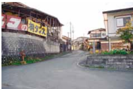
(写真上) 原町通りの造り酒屋（会津屋）の土蔵 (写真下) 桜町渡船場への道（米沢舟屋敷跡）

町では、このたびの国選定を受け、文化的景観の歴史的・文化的価値に基づき、美しい町並みづくりや商業・観光の振興を図るとともに、地域の誇りと愛着を育むための情報発信や教育分野における取組みを進める予定です。