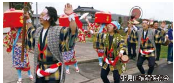
小見田植踊保存会

大江町内には、道海、楯山、小見地区に保存会があり、田植踊りが継承されています。いつまでも残したい民俗芸能であり、日本の原風景でもあります。