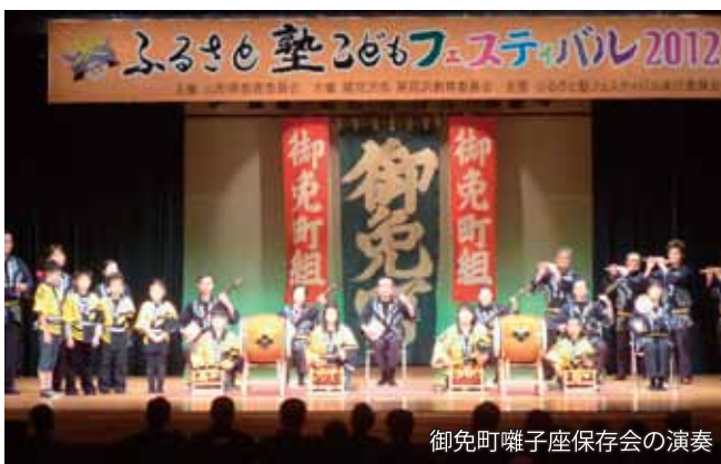
御免町囃子座保存会の演奏

小学生から高齢者までが一緒になって活動を展開し、演奏技術の継承に努めているとして、平成23年度に「山形ふるさと塾」村山地域優秀賞を受賞した御免町囃子座保存会が、平成24年10月14日、尾花沢市文化体育施設サルナートでの「ふるさと塾こどもフェスティバル2012」に出演しました。