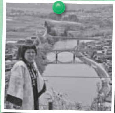
↑ 楯山公園から見た町の風景 この「日本一」の眺めを多くの方に 見ていただきたいです！