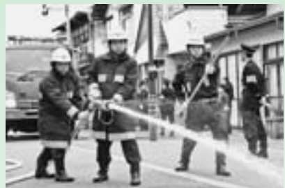
▲平成31年度春季消防演習の様子