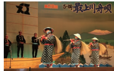
最上川舟唄保存会