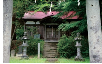
大瀧山不動尊 (波切不動堂)