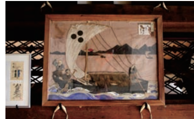
小鵜飼船押絵馬 (巨海院金毘羅堂奉納)