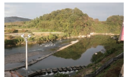
観光ヤナと榎木淵・大明神山(藤田)