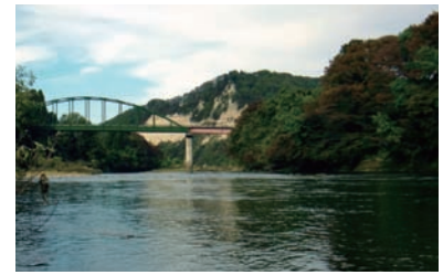
「明神ハゲ」と用橋(用)