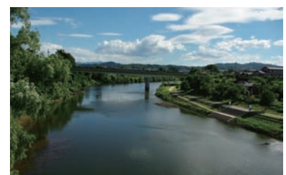
「米沢舟屋敷」跡から月布川合流点