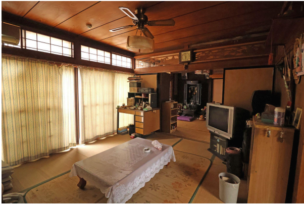
玄関のすぐ右側にある居間。喫茶店にありそうなシーリングファンライトに惹かれます。