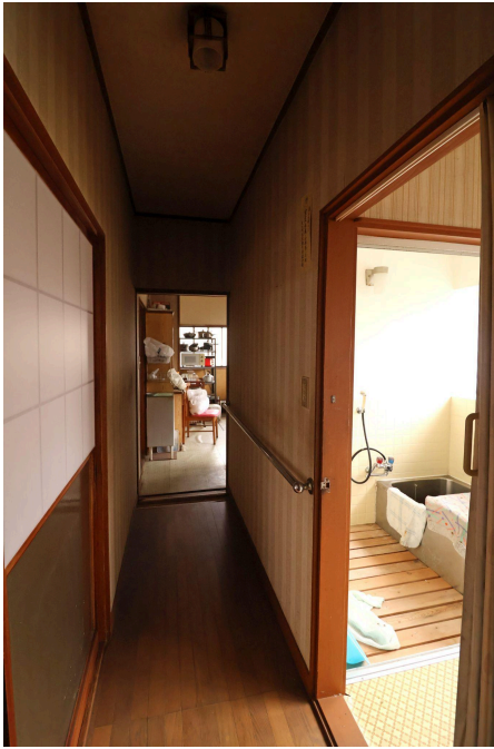
居間と洗面室の間の廊下。洗面スペースからおだやかな光が差し込みます。