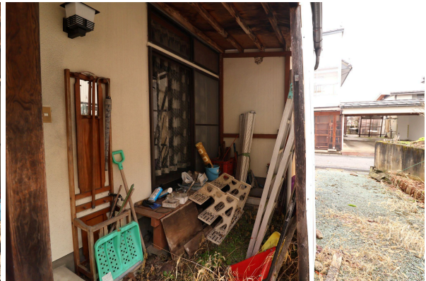
玄関の外。縁側では、春～秋には一服の時間を過ごすのもよし、冬は除雪道具をおいておけます。