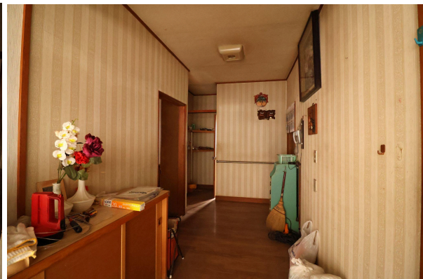
玄関には備えつけの靴箱も。長靴を置けるスペースもあります。