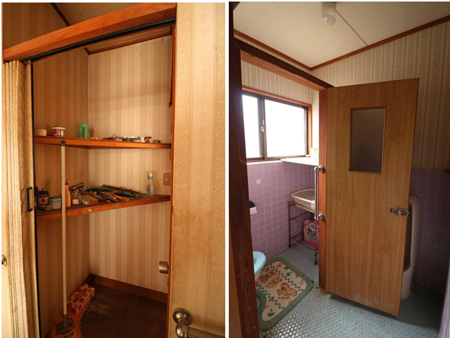
お手洗いは修繕が必要だと思われるので、お好みのスタイルに変身させてくださいね。