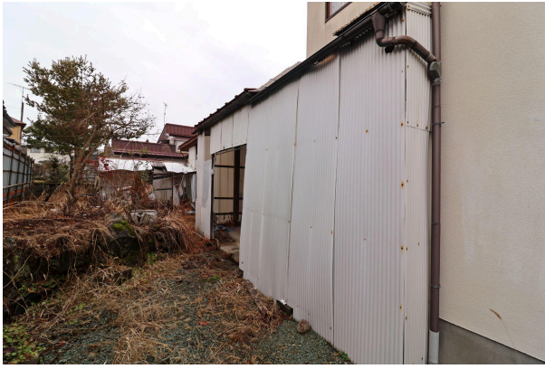
玄関前の木が生える場所では、お庭づくりをしても楽しそう。